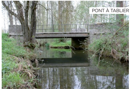
PONT À TABLIER